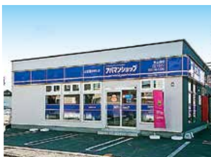
アパマンショップ 帯広西店