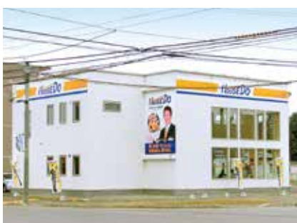
ハウストゥ! 帯広店