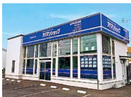
アパマンショップ 帯広南店